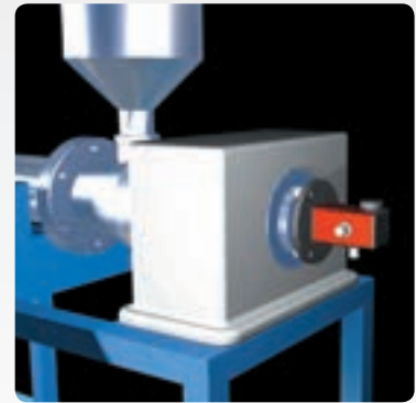
ギアボックススピンドルに設置したレーザー発信器