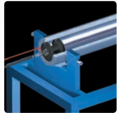
バレル内に設置したアダプタ付き受光器