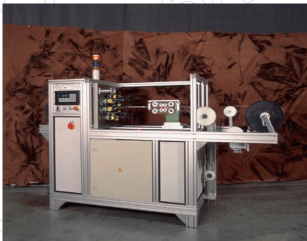
HORIZONTAL FINE WIRE BRAIDERS