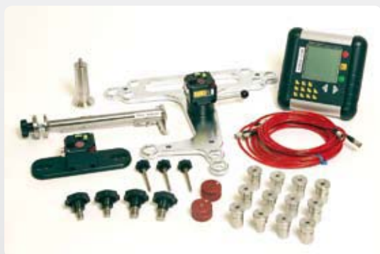
例) 「Vestas」社専用システム