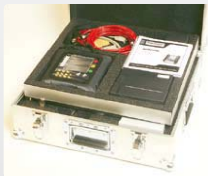
ディスプレイユニットと専用プリンター